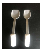
NE00060 / NE00061