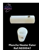
Manche Neater Eater Ref. NE00047

Code ISO 15.09.13 pour les cuillères et la cuillère-fourchette 15.09.18 pour les assiettes et le bol