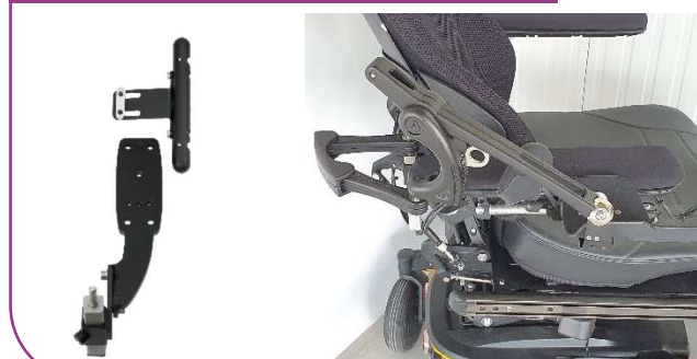
Pour fauteuil roulant électrique