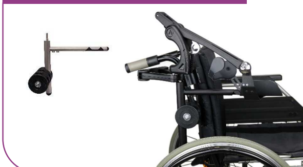
Pour fauteuil roulant manuel